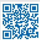
Сервис «Личный кабинет»

Электронный сервис ФНС России «Личный кабинет налогоплательщика для физических лиц» позволяет не выходя из дома: